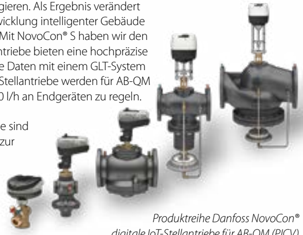
Produktreihe Danfoss NovoCon® digitale IoT-Stellantriebe für AB-QM (PICV)

Danfoss NovoCon® M, L und XL sind unsere neuesten digitalen IoT-Stellantriebe. Sie sind konstruiert für AB-QM Ventile (PICV) mit hohem Durchfluss von DN 40 bis DN 250 zur Regelung von Auslegungs-Durchflüssen zwischen 3-370 m 3 /h. Die NovoCon®-Stellantrieb-Serie erweitert die Einsatzmöglichkeiten digitaler Stellantriebe und deckt alle wichtigen hydraulischen HLK-Anwendungen ab. Dies ermöglicht eine hochpräzise Regelung und den Datenaustausch der GLT mit Klimageräten, Kühlern und anderen hydraulischen Anwendungen mit hohem Durchfluss.