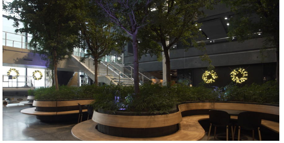
Hem yeraltı suyu ısıtma ve soğutma sistemi hem de güneş hücreleri otelin çevre dostu profilinin dayandığı temelin bir parçasını oluşturuyor.

Yeraltı suyu soğutma sistemi, otelin yakınındaki iki yerde 110 metre derinlikte iki sondaj çalışması gerektirdi. Yazın, 7- 9°C sıcaklığındaki yer altından gelen su kuyulardan otelin bodrumundaki bir dizi su deposuna pompalanır; burada da bir ısı eşanjöründen geçer ve ısının toplandığı ve daha sıcak aylarda ısının depolandığı bir ısı deposuna geri döner. Isı eşanjöründe soğutulan