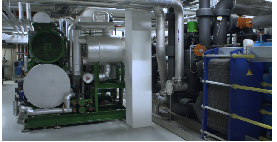
Isı eşanjöründe soğutulan su odaları istenen sıcaklığa soğutmak üzere binada dolaşıma sokulur. Aktif soğutma gerekmez.

su odaları istenen sıcaklığa soğutmak üzere binada dolaşıma sokulur. Aktif soğutma gerekmez. COP (performans katsayısı) 40'a kadar çıkabilir; bu da soğutma gücünün tesisatın tükettiği elektriğin 40 katı olduğu anlamına gelir.