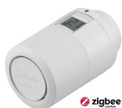
Danfoss Ally™ thermostat de radiateur électronique