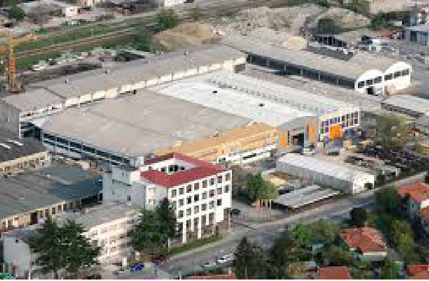
Gostol-Gopan'ın şirket merkezi Slovenya'nın Nova Gorica şehrinde bulunuyor