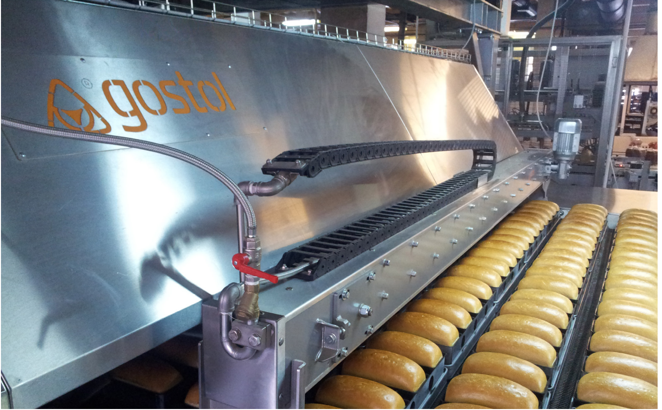
Gostol'un Rusya'daki örnek fırını