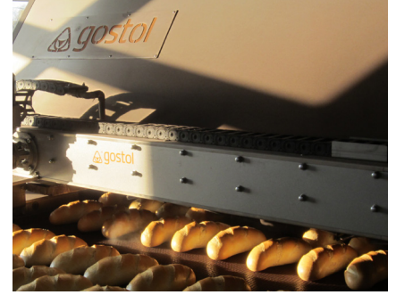
Gostol'un Romanya'daki örnek fırını