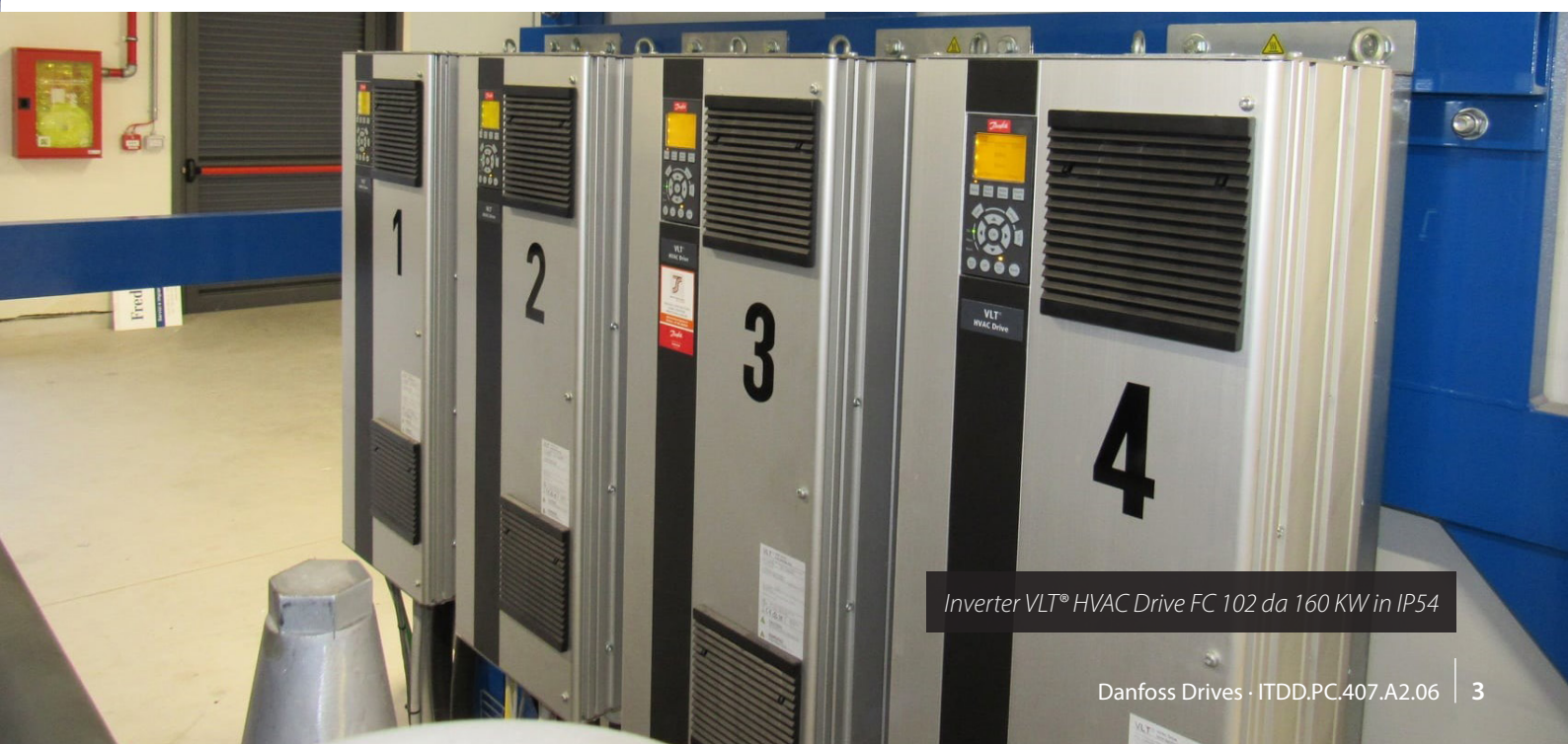
Inverter VLT® HVAC Drive FC 102 da 160 KW in IP54

Altri drives di taglia minore sono stati utilizzati per la regolazione di velocità delle ventole dei condensatori evaporativi, dei gruppi di pompaggio e delle unità di trattamento aria per le sale di lavorazione.