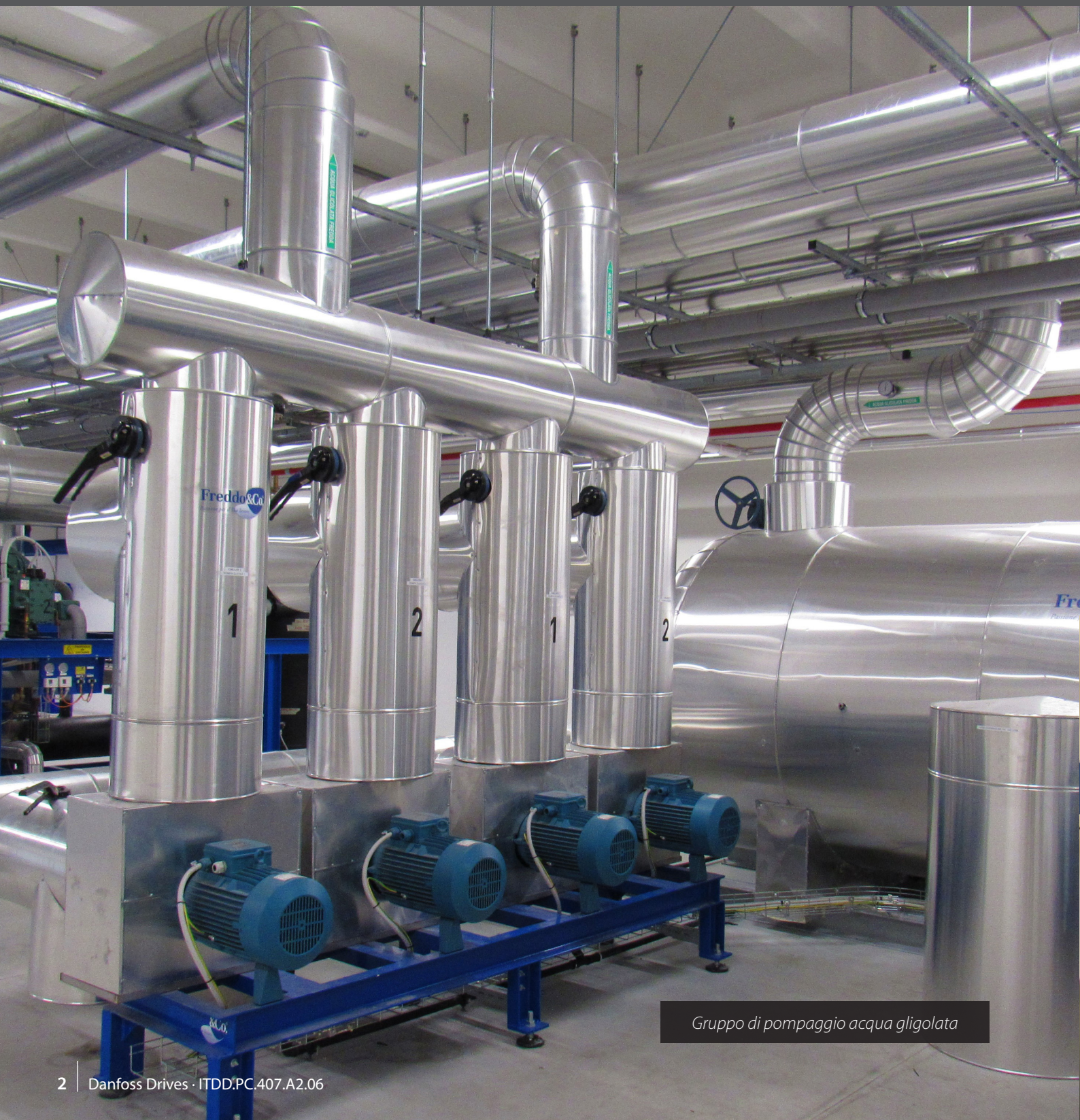
Gruppo di pompaggio acqua glicolata