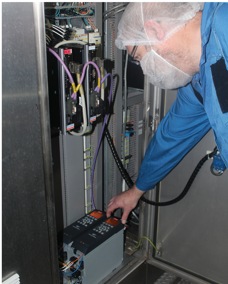
VLT® AutomationDrive med Integrated Motion Controller giver store omkostnings- og tidsbesparelser hos Danish Crown.

Positionering og synkronisering udføres typisk ved hjælp af et lukket sløjfe servosystem – dette på trods af at mange af disse applikationer ikke