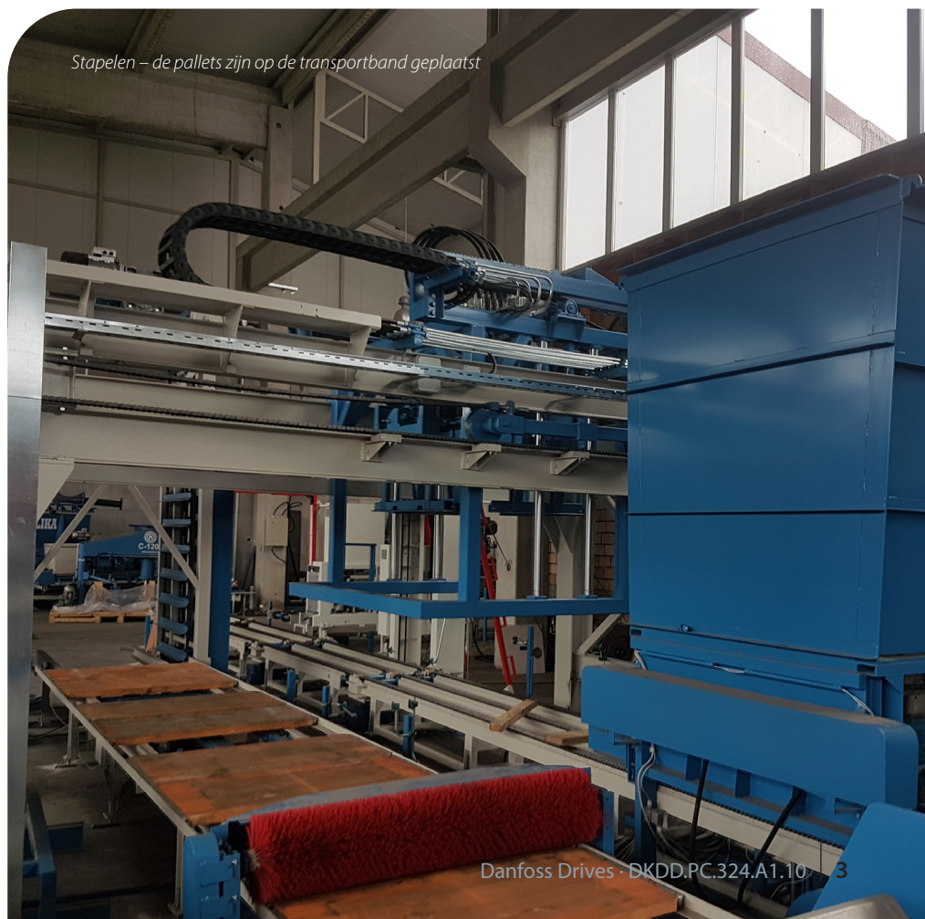
Stapelen – de pallets zijn op de transportband geplaatst