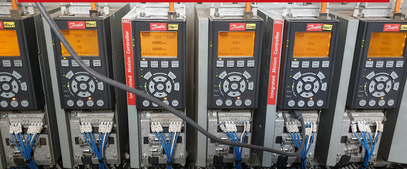
Blauwe kabels geven de communicatie van de encoder weer – de gele kabels zijn voor Modbus TCP-communicatie