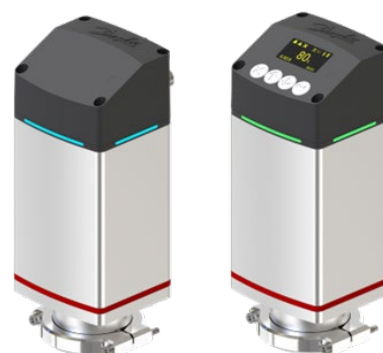
New generation ICAD B