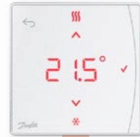
Icon2™ RT -huonetermostaatti infrapuna-anturilla

Langalliset 24 V Icon-termostaatit seinälle ja seinän sisään asennettavina versioina