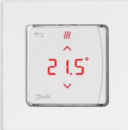
Seinän sisään asennettavat versiot