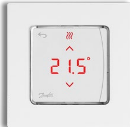
Icon2™ 24 V RT -huonetermostaatti, seinälle asennettava

Langalliset 24 V Icon-termostaatit seinälle ja seinän sisään asennettavina versioina