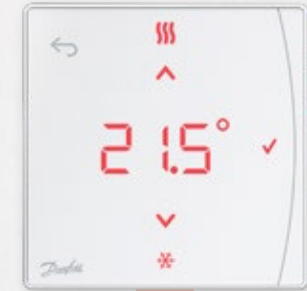
Icon2™ RT -huonetermostaatti infrapuna-anturilla

Infrapunasäde rekisteröi lattian lämpötilan erittäin tarkasti.