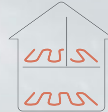
Järjestelmä automaattisella tasapainotuksella

Danfoss Icon2™ -järjestelmän automaattisen tasapainotuksen avulla järjestelmä lyhentää pienissä huoneissa olevien lyhyiden putkien päälläoloaikaa ja priorisoi suurten huoneiden pidempiä putkia silloin, kun lämmöntarve on suuri. Näin varmistetaan, että käytettävissä oleva rajoitettu energia jaetaan kaikkiin huoneisiin mahdollisimman tehokkaasti ja mukavasti.