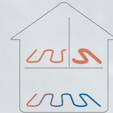
Järjestelmä ilman automaattista tasapainotusta