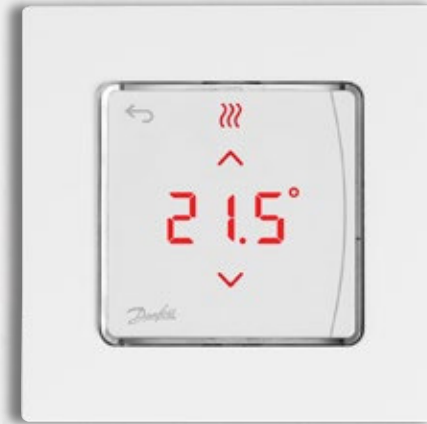
Seinälle asennettava versio