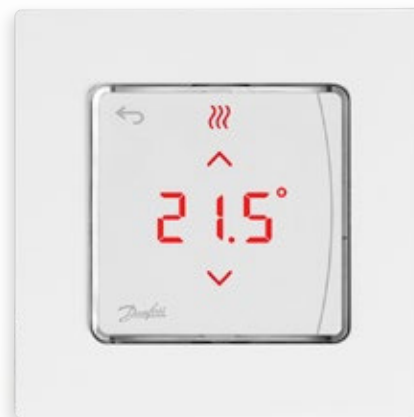
Icon2™ 24 V RT -huonetermostaatti, seinän sisään asennettava

Infrapunasäde rekisteröi lattian lämpötilan, joten lämpötilan hallinta on erittäin tarkkaa.