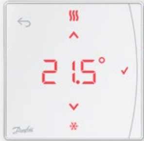
Icon2™ RT -huonetermostaatti