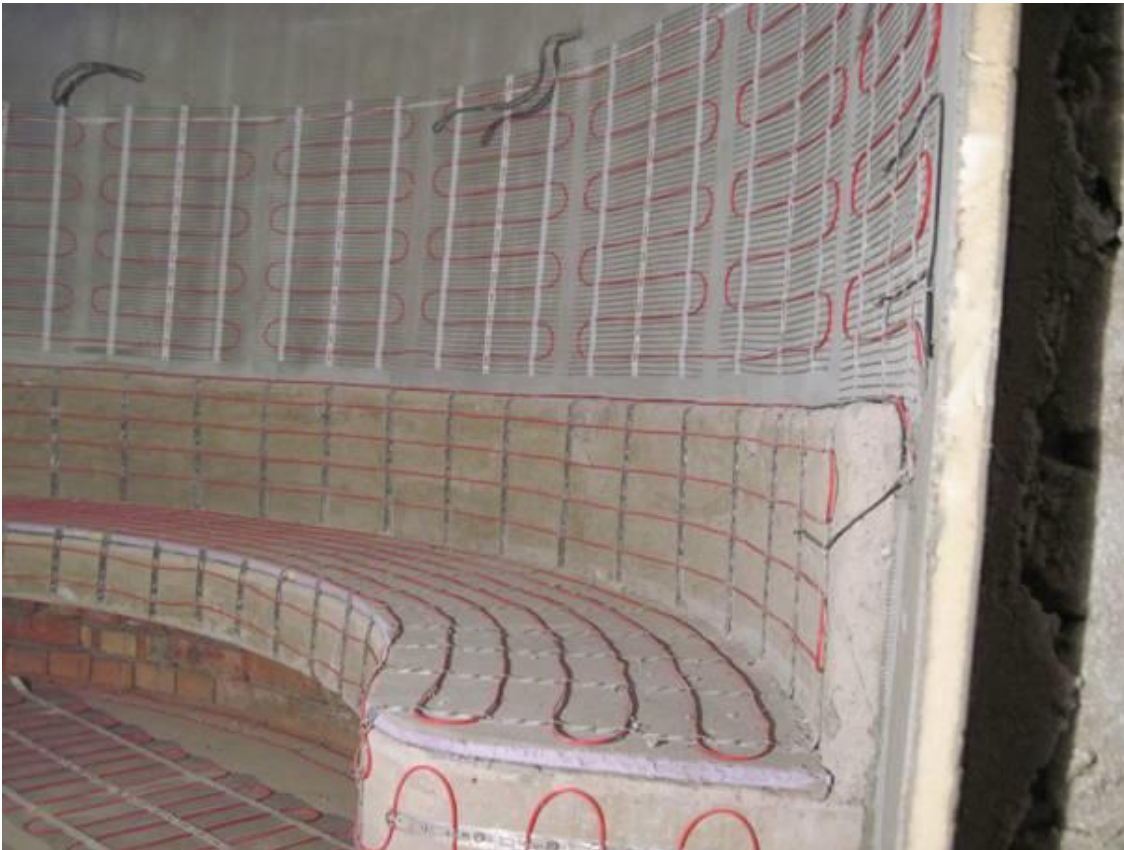
Рис. 4. Монтаж нагревательного мата DEVIheat™ 150S (DSVF-150) на стене в турецкой бане.