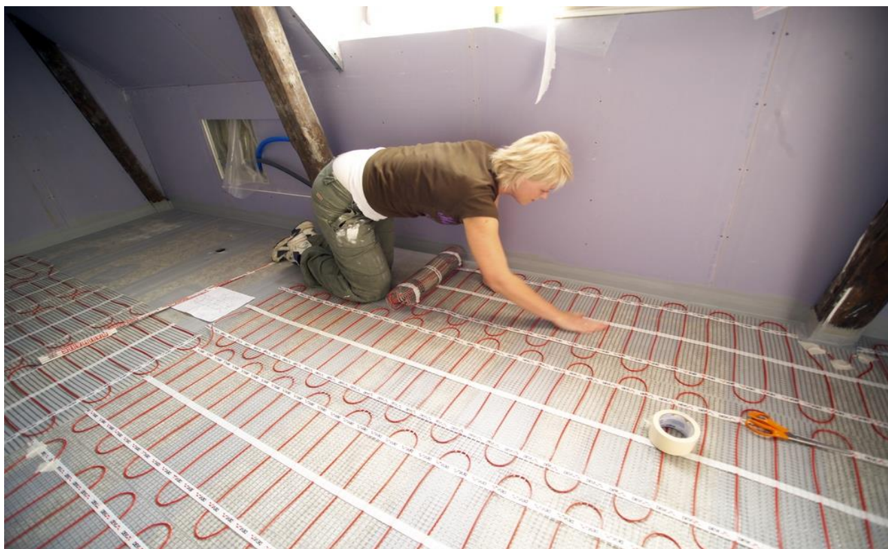
Рис. 3. Монтаж нагревательного мата DEVIheat™ 150S (DSVF-150) на основание из плит ГВЛ под плитку.

При выборе нагревательных матов необходимо учитывать допустимый разброс параметров, приведенных в технических характеристиках, и возможные отклонения напряжения питающей сети.