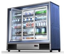
Armoires à portes vitrées