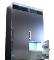
Réfrigérateur et congélateur à usage commercial