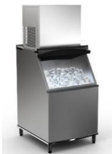
Machine à glace à usage commercial