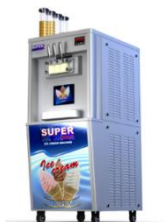
Machine de crèmes glacées et boissons glacées