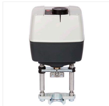
Электрический привод AMV/AME 65x

Приводы AMV и AME в основном используются с клапанами VS, VM, VB и VFM или с не зависящими от перепада давления клапанами AVQM и AFQM.