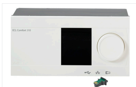
Регулятор ECL Comfort 310 с ключом приложения

Ключ приложения A230 — так называемое решение «четыре-в-одном», которое предлагает: 1) регулирование температуры в отопительных установках; 2) регулирование температуры в охладительных установках; 3) защиту от слишком высоких уровней влажности и 4) программу сушки пола (стяжки) в зависимости от выбранного подтипа ключа.