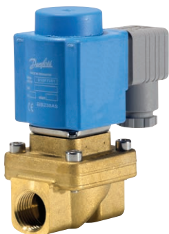
Tabela 1. Zawory EV250B w wersji NO (beznapięciowo otwarte), z cewką BB 230V a.c. i wtykiem IP65 (dostępne są także zawory sterowane napięciem 12V d.c., 24V d.c. lub 24V a.c.)

Posiadają atest PZH dopuszczający je do stosowania bezpośrednio na wodzie pitnej.