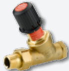
2 AVDO overstortregelaar