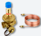
1 ASV-PV drukverschilregelaar