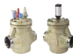
ICV Flexline™ – Reguleringsventiler

Flexline™ serien inkluderer tre populære produktkategorier, hvor designet giver intelligent enkelthed, tidsbesparende effektivitet og avanceret fleksibilitet.