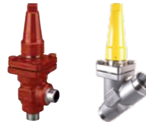
SVL Flexline™ – Linjekomponenter

Alle produkter er baseret på et modulært design uden funktionaliteter i husene. Denne opbygning reducerer kompleksiteten lige fra designfasen til installeringen, idriftsættelsen og service. Alle områder der er vigtige for at minimere levetidsomkostninger og opnå store besparelser.