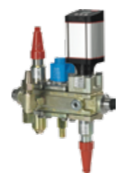
ICF Flexline™ – Komplette ventilstationer