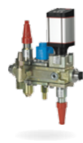
ICF Flexline™ – Stations de vannes complètes