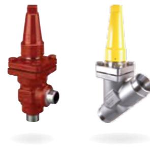
SVL Flexline™ – Composants de ligne

Tous ces produits sont élaborés selon une même conception modulaire d'un corps unique. Cette configuration permet de réduire la complexité depuis la phase de conception jusqu'à l'installation, la mise en service et la maintenance. Tous ces facteurs sont déterminants pour la réduction des coûts d'entretien, et permettent de réaliser d'importantes économies.