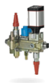
ICF Flexline™ – kompletne stacje zaworowe