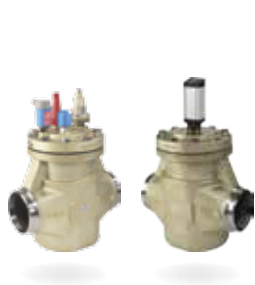
ICV Flexline™ – zawory regulacyjne

Zaprojektowana z myślą o inteligentnej prostocie, ekonomicznej skuteczności oraz zaawansowanej elastyczności seria Flexline™ obejmuje trzy popularne kategorie produktów: