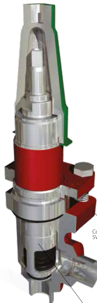
Corps de vanne SVL standard