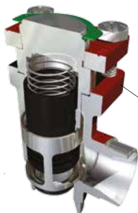
Corps de vanne SVL standard

Les SCA sont des vannes clapet dotés d'une fonction de vanne d'arrêt intégrée. Les CHV sont des clapets anti-retour simples. Ces vannes s'ouvrent à des pressions différentielles très faibles, permettant ainsi un débit optimal. Elles sont faciles à démonter en cas d'inspection et de réparation. Les vannes SCA sont équipées de capuchons à évent et d'un contre-siège interne qui permet de remplacer le joint de la tige même lorsque la vanne reste sous pression. Les caractéristiques d'ouverture des orifices en V, dont la découpe est faite au laser, sont excellentes. La flexibilité interne du cône de vanne permet d'obtenir une excellente étanchéité du siège de vanne. Un effet d'amortissement bien équilibré entre le piston et le cylindre offre une protection optimale en cas de charges faibles et contre les pulsations.