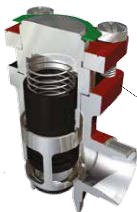
Corps de vanne SVL standard

Les vannes SCA sont équipées de capuchons à évent et d'un contre-siège interne qui permet de remplacer le joint de la tige même lorsque la vanne reste sous pression. Les caractéristiques d'ouverture des orifices en V, dont la découpe est faite au laser, sont excellentes. La flexibilité interne du cône de vanne permet d'obtenir une excellente étanchéité du siège de vanne. Un effet d'amortissement bien équilibré entre le piston et le cylindre offre une protection optimale en cas de charges faibles et contre les pulsations.