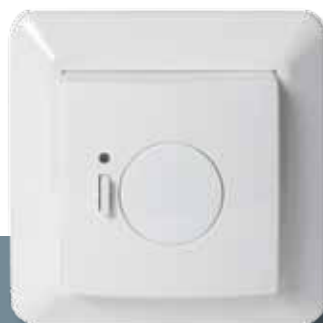
Podlahový termostat Danfoss Link™ FT