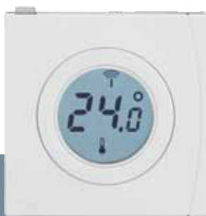
Izbový snímač teploty Danfoss Link™ RS

Elektrické podlahové výhrevné telesá sa často používajú ako doplnkový spôsob vykurovania k radiátorom alebo mimo hlavnej sezóny ako výlučný tepelný zdroj. Systém je veľmi svižný a zaručuje príjemnú teplotu okolia kedykoľvek počas dňa.