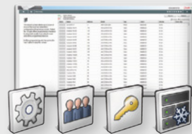
Asetukset Käyttäjät Lisenssit Laitteisto

Apuohjelmat ohjaavat käyttäjää perustoiminnoissa vaiheittaisilla ohjeilla. Selkeä näyttö sisältää kätevät vedä- ja pudota-toiminnot. Apuohjelma nopeuttaa asennusta ja estää konfigurointivirheet.