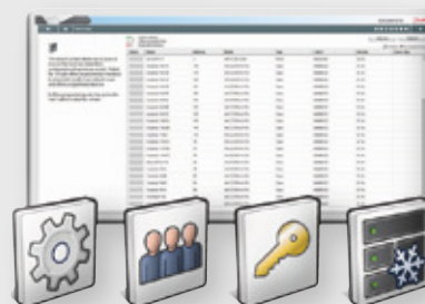
Præferencer Brugere Licensering Layout

Webguiderne er beregnet til at hjælpe brugeren i et trin-for-trin-format, som giver ren skærmformatering og træk-og-slip-funktioner. Nettoresultatet er forbedret idriftsættelsestid og mindre risiko for konfigurationsfejl.