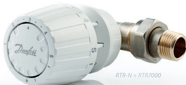
RTR-N + RTR7000

Для того чтобы обеспечить дополнительный комфорт для жильцов, радиаторные клапаны должны быть оснащены терморегулирующим элементом. Это позволяет регулировать температуру в каждой комнате отдельно. Компания Danfoss предлагает широкий выбор радиаторных элементов для тех, кому необходим максимальный контроль, а также превосходное качество и дизайн.