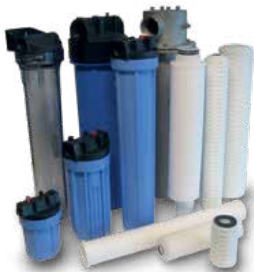
Una amplia gama de carcasas de filtro y cartuchos para prefiltración disponibles.

Se recomienda usar filtros Danfoss como pretratamiento