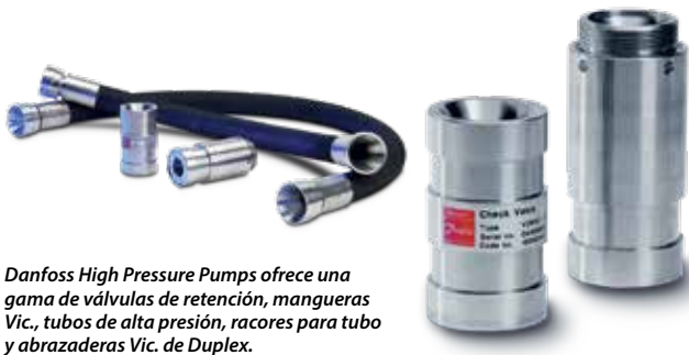
Danfoss High Pressure Pumps ofrece una gama de válvulas de retención, mangueras Vic., tubos de alta presión, racores para tubo y abrazaderas Vic. de Duplex.

Capacidad: amplio rango de caudales que se adapta a nuestra gama de bombas