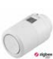
Danfoss Ally™ thermostat de radiateur électronique