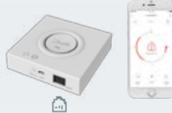
Danfoss Ally™ LAN Gateway Système à distance par App