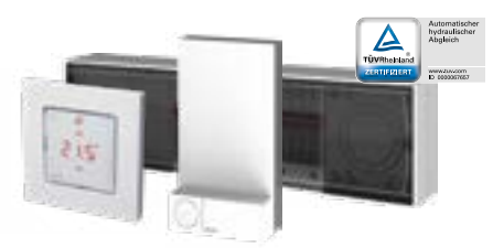
Danfoss Icon™ 24V MC/OTA Répartiteur de réglage Danfoss Icon™ Thermostat d'ambiance Zigbee Modul radio