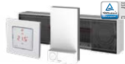
Danfoss Icon™ 24V MC/OTA Hauptregler Danfoss Icon™ Raumthermostat Zigbee Funkmodul