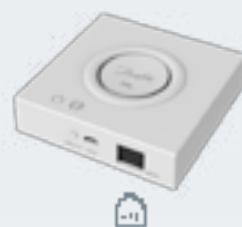
Danfoss Ally™ LAN Gateway App-Steuerung