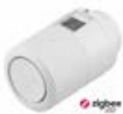
Danfoss Ally™ Heizkörperthermostat