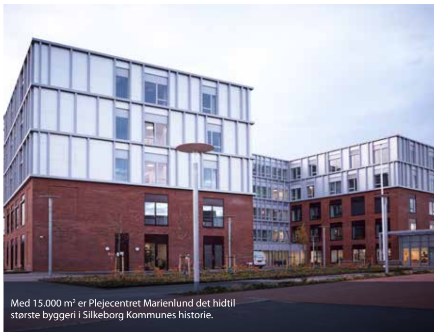
Med 15.000 m 2 er Plejecentret Marienlund det hidtil største byggeri i Silkeborg Kommunes historie.