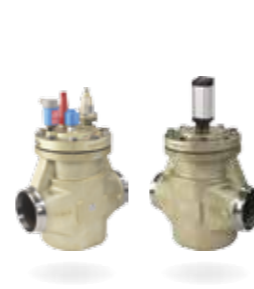
ICV Flexline™ – Válvulas de control

Diseñada para proporcionar sencillez inteligente, la máxima eficiencia y una avanzada flexibilidad, la serie Flexline™ se compone de tres populares categorías: