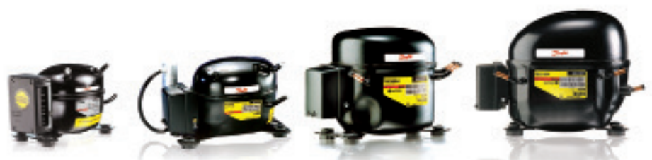
Kompressorer för R600a