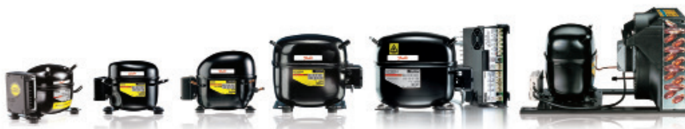
Kompressorer och luftkylda aggregat för R290