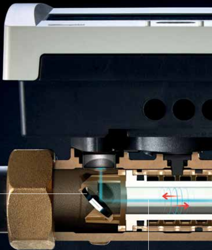
夹角反射器 会反射超声波信号。