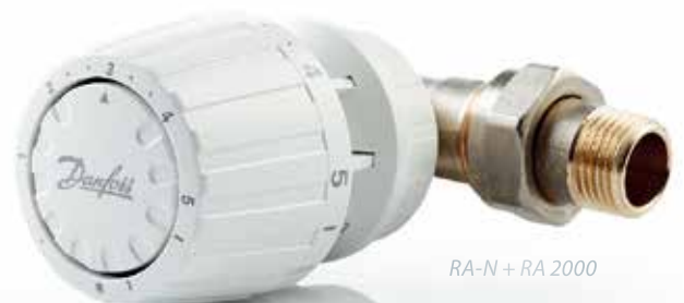
RA-N + RA 2000

Um komfortabel heizen zu können, müssen die Heizkörperventile über eine Thermostatregelung verfügen. So lässt sich die Temperatur in jedem Raum separat regeln. Für alle Kunden, die Wert auf eine optimale Regelung legen und keine Kompromisse hinsichtlich Qualität und Design machen möchten, hat Danfoss eine breite Palette an Heizkörperthermostaten im Sortiment.