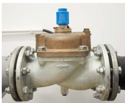
Zawór elektromagnetyczny EV220B