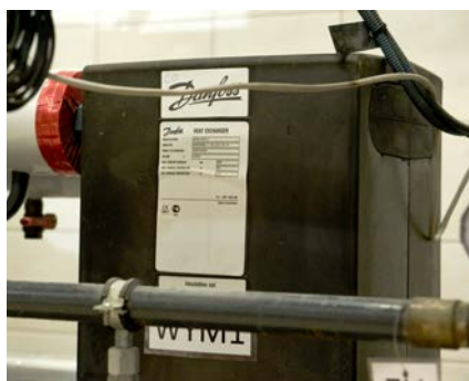
Wymienniki lutowane HEX