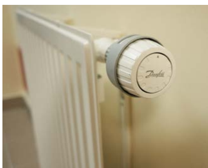
Głowica termostatyczna RA 2920

przed Legionellą odpowiadają wielofunkcyjne zawory MTCV. Ciepła woda dostępna jest na każde żądanie. Urządzenia te są istotnymi elementami całej instalacji, ze względu na funkcje, które pełnią.