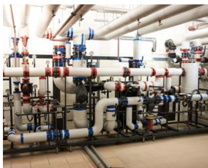
Węzeł cieplny DSE Large w budynku „O”