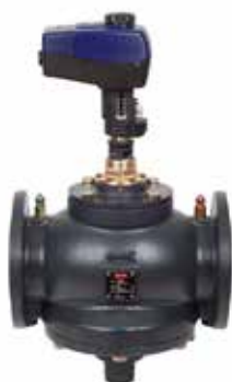
AB-QM DN 65 med AME 435 QM