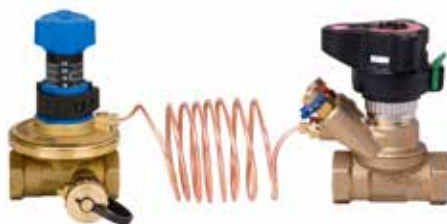
Indreguleringsventiler ASV-PV og ASV-BD