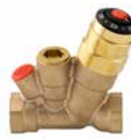
Cirkulationsventil MTCV A