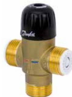
TVM-W Termostatisk blandeventil