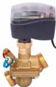
AB-QM DN 25 med AME 120