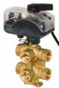
6-vejsventil ChangeOver 6