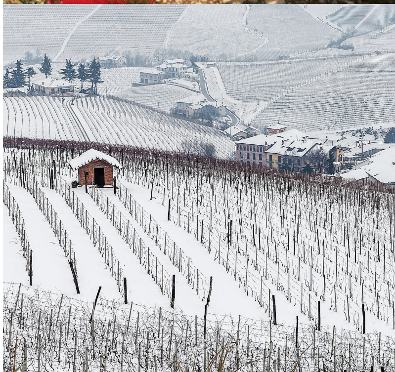
Schéma théorique d'un palissage