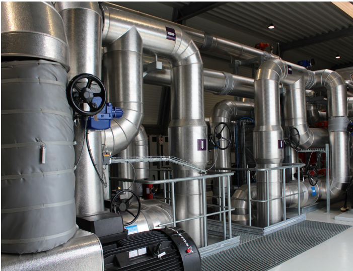
VLT® AQUA Drive styrer alle otte pumper på Silkeborg solvarmeanlæg.

Lækage i vandrør er en velkendt årsag til energitab. Derfor har de i Silkeborg installeret et system, der udløser en alarm, hvis en lækage opdages. Systemet registrerer lækagen ved en modstandsændring. Derudover udføres årligt lækagekontrol.