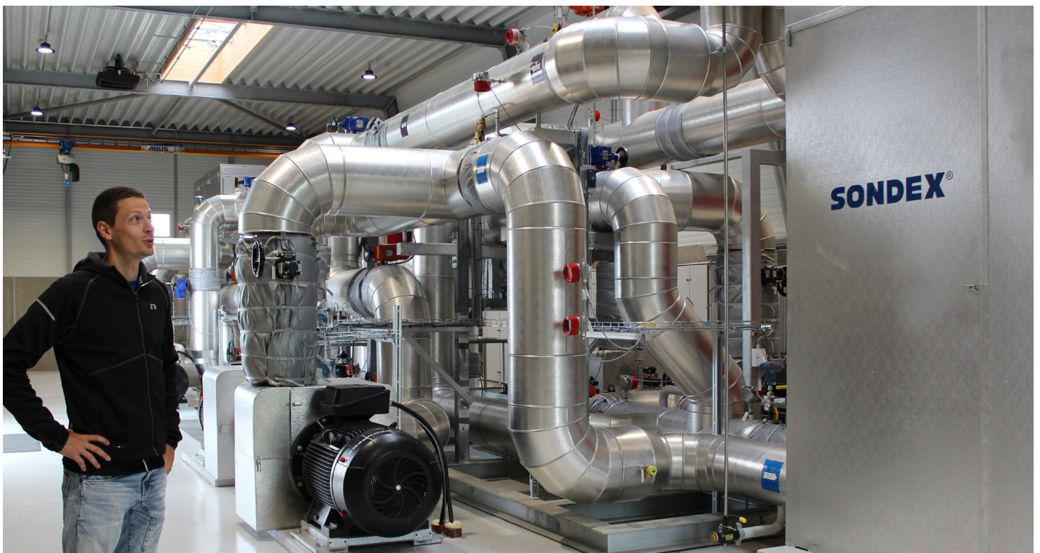
Under en guidet tur gav Per Hvilshøj Christiansen en introduktion til løsningen af varmeoverførsel fra SONDEX®.

Ved at have en høj delta T, kan man operere ved et lavt flow. Dét betyder, at man ikke behøver at investere i større pumper. Samtidig kan en lille LMTD (Logarithmic Mean Temperature Difference) få temperaturen på fjernvarmesiden så tæt på solvarmeanlæggets temperatur, så der kan overføres så meget energi som muligt.