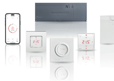
Danfoss Icon2™ système