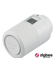
Danfoss Ally™ thermostat de radiateur électronique