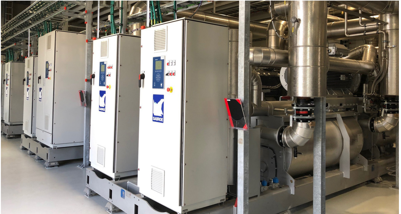
Sabroe®-varmepumper med variabel styringskontrol leveres af Johnson Controls

er lokale bygningsejere, Tårnby Forsyning og Centralkommunernes Transmissionselskab (CTR). Samarbejdet mellem disse interessenter og den fælles ambition om at finde en miljøvenlig og omkostningseffektiv løsning har været altafgørende for udviklingen og implementeringen af Tårnby-anlægget.