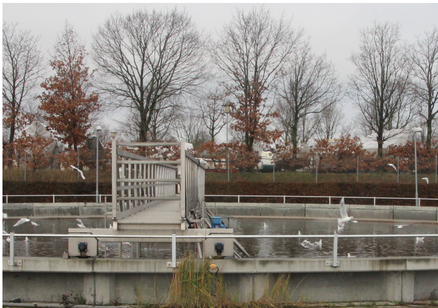
Tårnby kraftvarmeværket ligger i nærheden af Tårnby spildevandsrensning

Det nye Tårnby-anlæg ligger i området omkring Københavns Lufthavn og