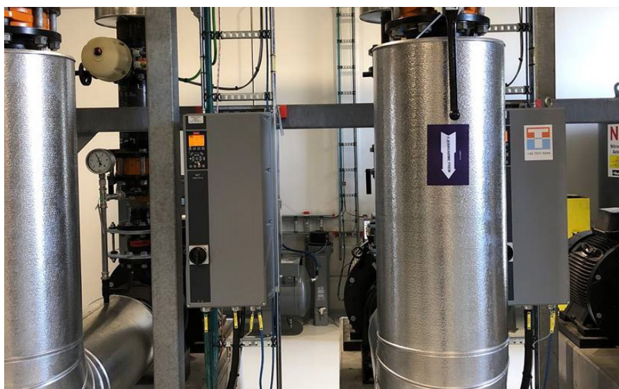
Hele anlægget strømforsynes af 27 Danfoss VLT®-frekvensomformere fra 0,75 til 400 kW.

Ambitionen med det nye Tårnby-fjernkølingsanlæg er ikke kun at levere et miljøvenligt kølingsalternativ til private tagventilationsanlæg, men også at stille en mere økonomisk løsning til rådighed.