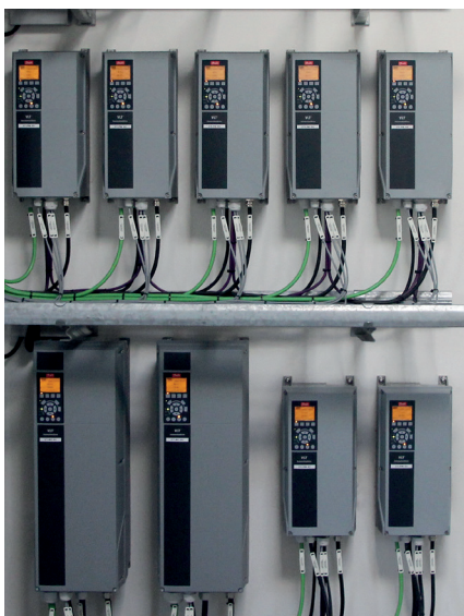
MEC – BioGas har anvendt tæthedsklasse IP55 på en del af deres VLT® AutomationDrive FC 302, da denne type er særligt velegnet til installation i krævende miljøer.