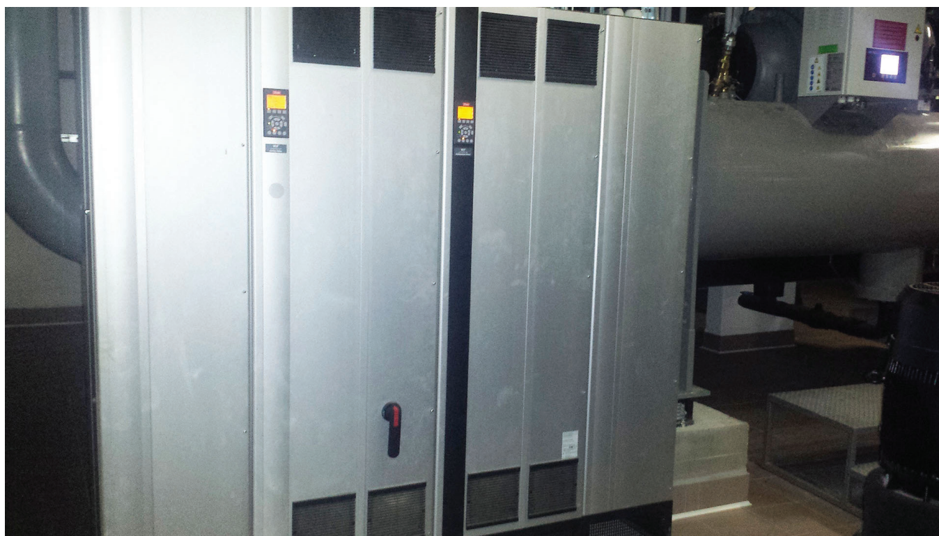
Deze VLT® Low Harmonic Drives regelen de nieuwe compressoren in de technische ruimte.

In overleg met de ontwerper en het ziekenhuis adviseerde Danfoss de actieve oplossing VLT® Low Harmonic Drive (LHD), waarbij de frequentieregelaar en het actieve filter zijn geïntegreerd in één product. Het actieve filter is parallel aan de frequentieregelaaringang gemonteerd; daardoor blijft de frequentieregelaar normaal werken als het filter defect raakt, zodat ook het koelsysteem blijft werken. Belangrijke factoren die bij het besluit van het ziekenhuis hebben meegewogen, waren de reserveonderdelenlijst, 24/7 serviceondersteuning en een soepele inbedrijfstelling.