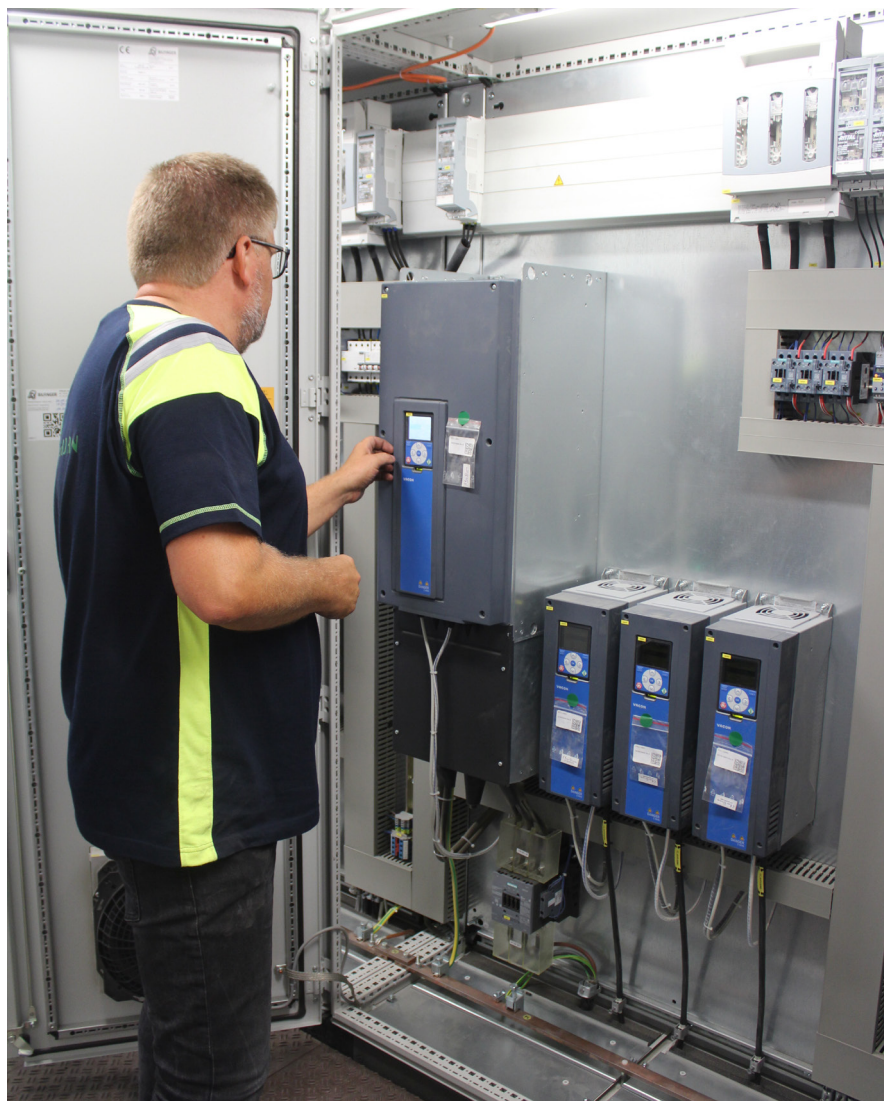
Danfoss Drives' VACON® 100 er leveret af Bilfinger direkte fra Tyskland i en container, klar til at blive taget i brug, da anlægget blev sat i drift i april 2018.

På anlægget i Kalundborg renses biogassen til samme kvalitet som naturgassen og den kan derfor uden videre lagres og distribueres i det danske naturgasnet. Den "rå" biogas indeholder 60% metan – resten er CO 2 og svovlbrinte. I efterbehandlingsanlægget renses gassen til en renhed på 99% metan. Svovlforbindelserne omdannes til svovlsyre, som tilsættes restproduktet som gødning. CO 2 vil evt. i fremtiden kunne sælges til andre kunder.