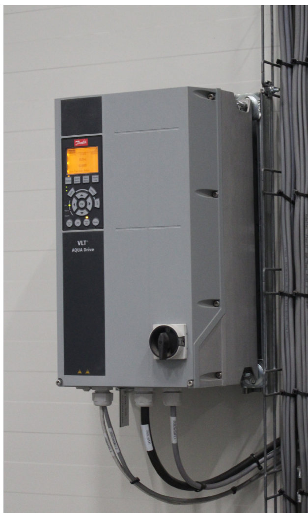
VLT® AQUA Drive FC 202 styrer pumper og blæsere på det store biogasanlæg.

Anlægget er bygget på et område ved Asnæsværket på inddæmmede havbund, som er opfyldt med slagger fra de danske kraftværker, hvilket er en god udnyttelse af slaggematerialet.