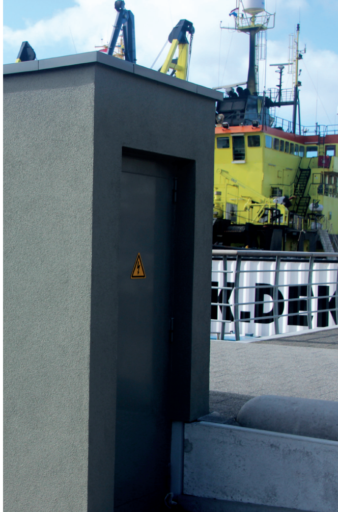
Het walstroomvoorzieningssysteem bevindt zich onder de grond. Hier is alleen de ingang zichtbaar.