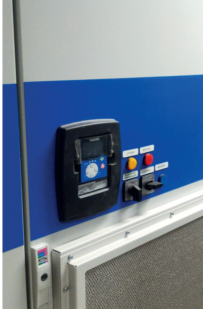
De VACON® NX Low Harmonic Drive levert een totaalvermogen van 2 MW.

Dankzij de nieuwe walstroominstallatie hoeven schepen niet langer luidruchtige, verontreinigende dieselgeneratoren te gebruiken terwijl ze in de haven aangemeerd zijn. Dat maakt een einde aan luchtverontreiniging en vermindert het geluid en de trillingen van stationair draaiende scheepsmotoren. Schepen in de haven van Scheveningen verbruiken gemiddeld meer dan 100 MWh per maand via de nieuwe walstroomvoorziening. Bij een gemiddelde van één liter per drie kWh betekent dat een besparing van meer dan 33.000 liter hoogwaardige scheepsdiesel per maand. Het gevolg is een drastische vermindering van de luchtverontreiniging