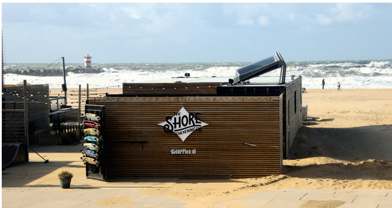
Scheveningen is het Nederlandse surfersparadijs waar bewoners en bezoekers genieten van de schone lucht en de golven.