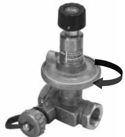
Fig. 5 / Abb. 5