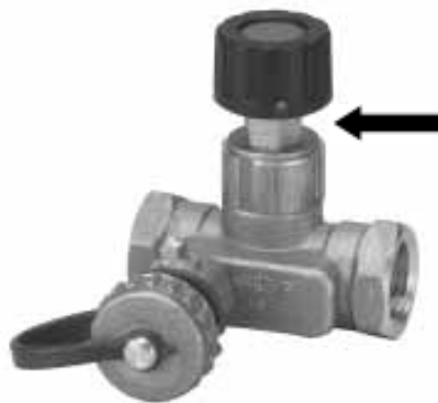
Fig. 4 / Abb. 4