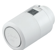
Danfoss Ally™ Testa termostatica elettronica