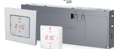
Danfoss Icon2™ Controllore principale Danfoss Icon2™ Termostati ambiente*