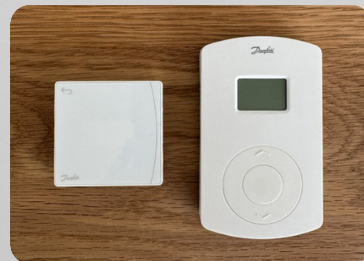
↑ Nowe, smukłe i eleganckie termostaty pokojowe Danfoss Icon2™ zastępują starszy system CF2+.