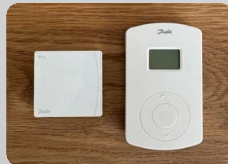
↑ De nye, slanke og elegante Danfoss Icon2™ rumtermostater erstatter det ældre CF2+ system.