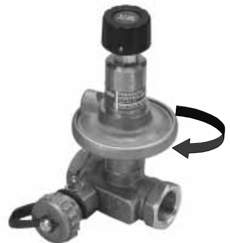
Fig. 5 / Abb. 5