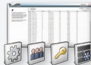
Préférences Utilisateurs Licence Structure

Les assistants Web sont conçus pour aider l'utilisateur étape par étape, via une fonction de glisser-déposer et une mise en page claire. Cela garantit une amélioration des temps de mise en service et une réduction du risque d'erreurs de configuration.